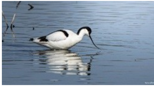
Oiseaux en Baie de Somme