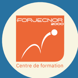
Forjecnor 2000 Blangy-sur-Bresle