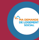
Ma demande de logement