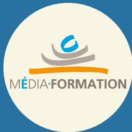
Média Formation Rouen