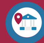
Point d'accès au droit